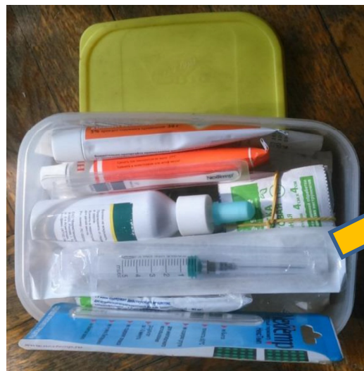
Контейнер под мази/гели