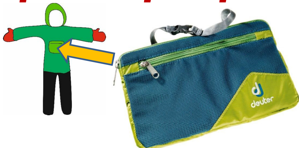
Экстренная аптечка (ампулы, шприц, бинт, 1-2 табл часто используемых)