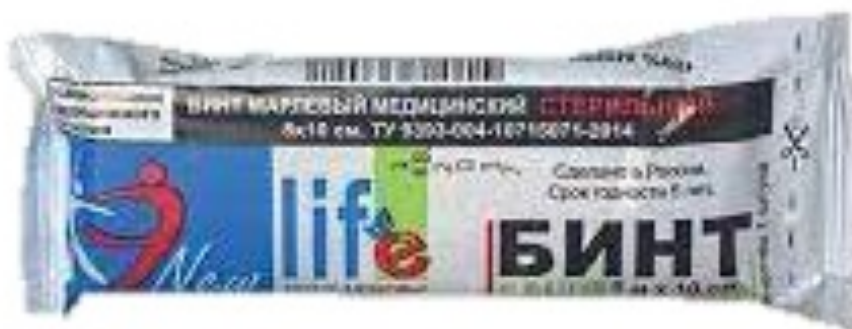
Бинт фирмы Newlife - хороший