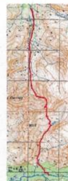
Карта участка маршрута

День 11, 6 марта: р. Гольцовка- пер. Арсентьева вост(1030, 1А)- р. Малая Белая